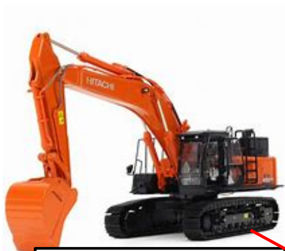
Exemplo de MÁQUINAS